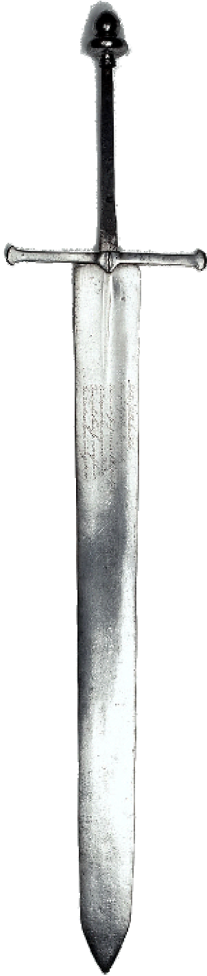
Zwaard waarmee Johan van Oldenbarnevelt werd onthoofd Rijksmuseum Amsterdam